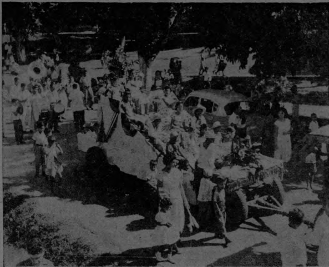
Aspecto del desfile que en celebración del quince de setiembre realizó la Escuela Central de Golfito. Una de las carrozas más aplaudidas se ve en primer plano seguida de la Filarmonía Municipal. Especial esplendor revistieron este año los festejos patrios.