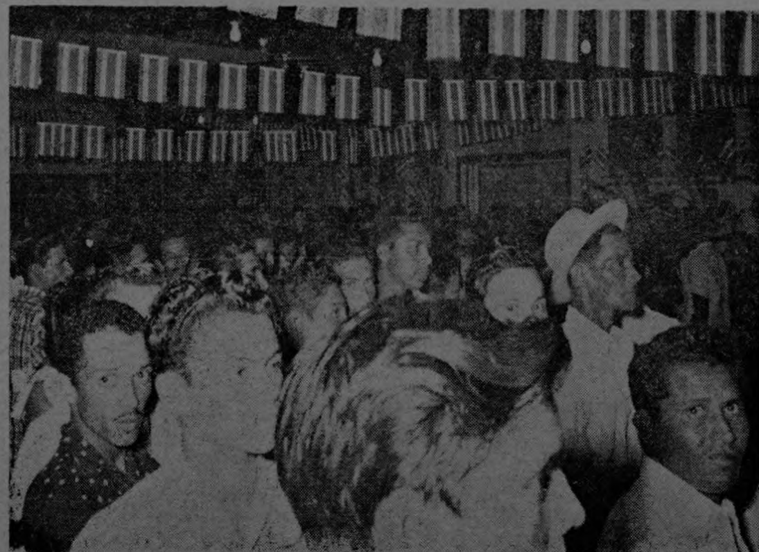
Muestra la gráfica un aspecto parcial de la gran cantidad de trabajadores del Valle de Coto, que acudieron al salón del club de trabajadores de Coto 47, el día sábado 13 de setiembre, primer día de fiesta deportivo-social con que los del valle celebraron la fecha de la Independencia Nacional.